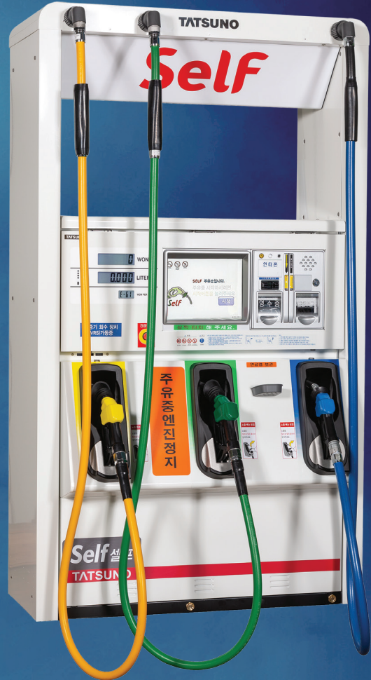
SUNNY-X Self 3662 (6복식)