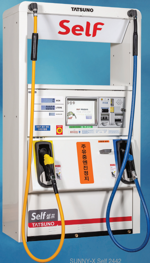
SUNNY-X Self 2442 (4복식)